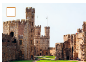
ETT MUSEUMS HEMSIDA